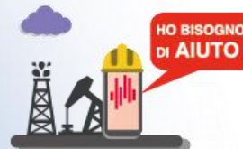
CHIAMATA VOLONTARIA DI EMERGENZA