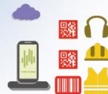
UTILIZZO DOTAZIONI INDIVIDUALI