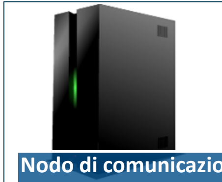
Nodo di comunicazione • Data-Room