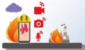
AUDIO E VIDEO REAL-TIME