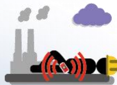
ALLARME PER UOMO A TERRA E INATTIVITÀ