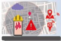
GEO-LOCALIZZAZIONE / GEOFENCING INGRESSO IN ZONA DI PERICOLO