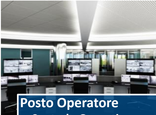
Posto Operatore • Centrale Operativa

E' possibile realizzare ambienti virtuali dedicati in modo esclusivo ad una specifica organizzazione composti essenzialmente da tre componenti software: