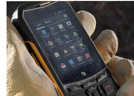
Terminale mobile • Territorio o Campus