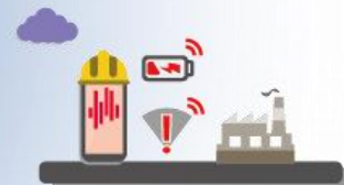
VERIFICA STATO CONNESSIONE E AUTONOMIA DELLA BATTERIA