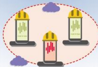
GESTIONE DINAMICA DEI GRUPPI E TEAM DI CRISI